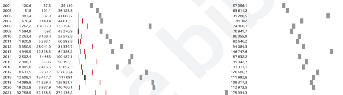
Lentelė Lotynų Amerikos regiono šalys. Iš Lietuvos požiūrio taško – bendras prekių importo ir eksporto mastas

Metai .....|CL.....|AR.....|Eksp. iš viso .....|Importas iš viso