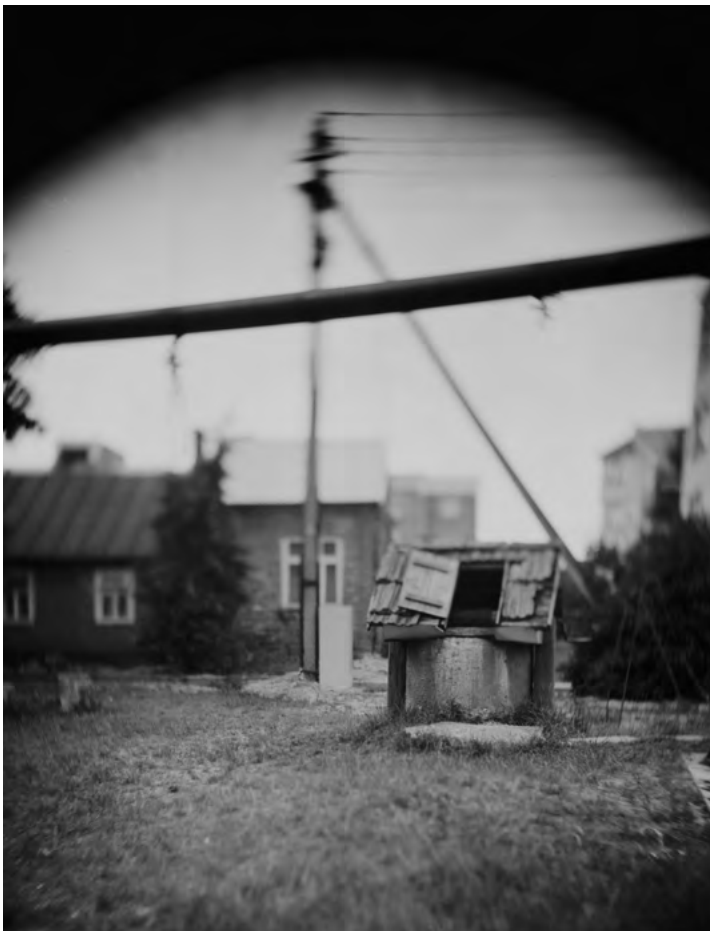
Still-film "Uzolankos 25 C", 2008 © Esther Shalev-Gerz

LES INSÉPARABLES, 2008 © Esther Shalev-Gerz